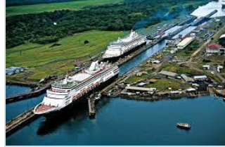
太平洋とカリブ海を結ぶパナマ運河