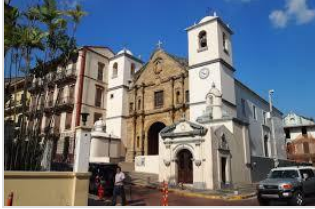
世界遺産にも登録されている旧市街のカスコ・ビエホ地区